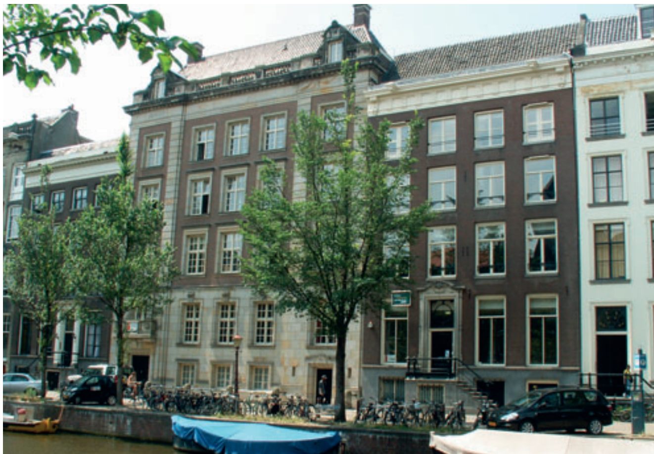
1. De twee gerenoveerde monumentale panden aan de Herengracht in Amsterdam.

Aan de Herengracht in Amsterdam zijn twee monumentale panden gerenoveerd waarbij tevens de eisen aan het comfort zijn verhoogd door de vraag naar koeling. Er is gekozen voor een concept, waarbij plafond-inductie-units met decentrale nabehandeling worden geïnstalleerd, opdat niet de gehele klimaatinstallatie moet worden vervangen. Hiermee wordt naast extra koeling ook een individuele ruimteregeling mogelijk.