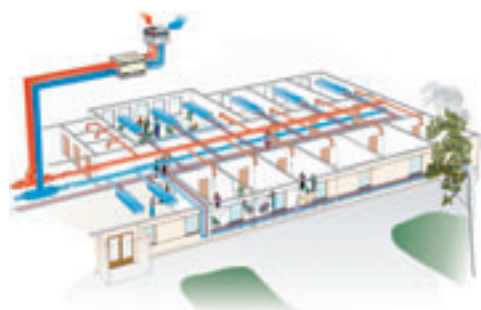
2. De bestaande installatie is gebruikt als basisvoorziening en uitgebreid met plafondinductie-units.