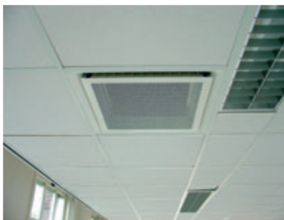
3. Bij de selectie van de plafondinductie-units moet rekening worden gehouden met de condities van de primaire lucht.

De plafondinductie-units, er is gekozen voor Swegon Parasol units, zijn voorzien van een constant volumeregelaar evenals alle aanwezige wervelroosters van de bestaande installatie. De plafondinductie-units zijn aangesloten op een gekoeld-watersysteem met een medium temperatuur van 15 tot 17 °C. Voor de aanvullende koeling is een aparte koelmachine opgenomen. Het is belangrijk om bij de selectie van de plafondinductie-units rekening te houden met de conditie van de primaire lucht.